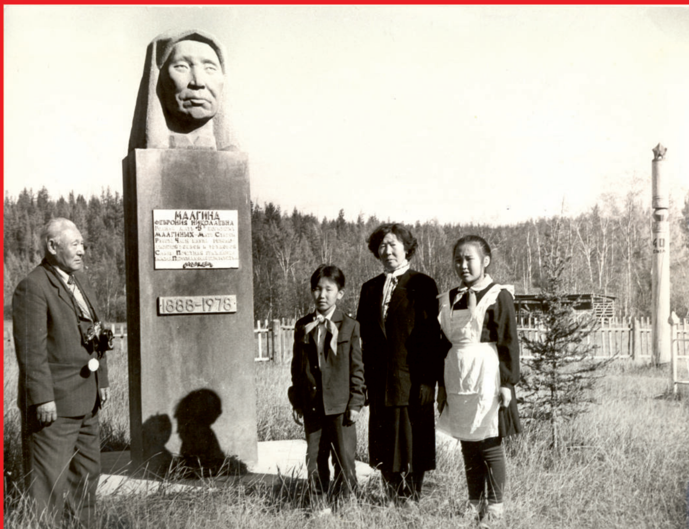
Памятник Ф.Н. Малгиной на территории музея-усадьбы Малгиных