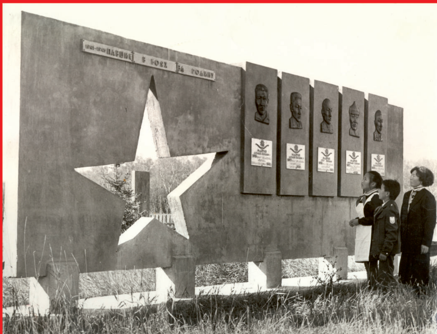
Мемориал братьям Малгиным на территории музея-усадьбы Малгиных